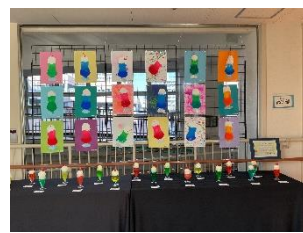
S部門 小中高 作品展示（一部）