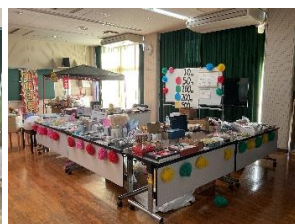
バザー 駄菓子屋さん