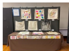
B部門 つばさ・いるか S部門 かもめ・つばさ 作品展示