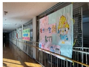
墨東祭スローガンのポスター (生徒会作成)