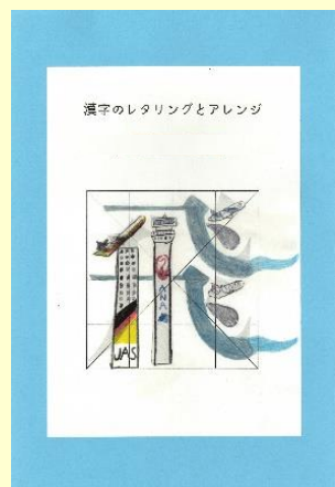
〔漢字のレタリングとアレンジ〕

岡山県の川崎医科大学・川崎医療福祉大学主催の第27回全国院内学級絵画展覧会で、いるか分教室2名、病院訪問つばさ学級4名が入賞しました。その中から2名が佳作に選ばれました。展覧会の作品は、Web上で公開されていますので、ぜひ検索してみてください。